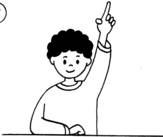
lever le doigt