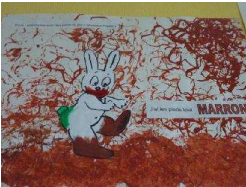
Impressions avec les pieds du jeu Monsieur Patate