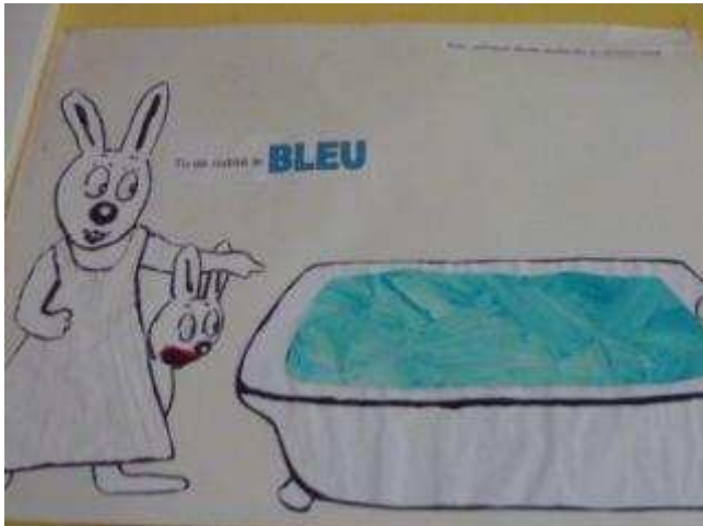
Impressions avec des mouchoirs trempés dans de la gouache diluée (réalisées sur une plus grande feuille puis découpées à la forme souhaitée, comme pour les fleurs et les fraises).