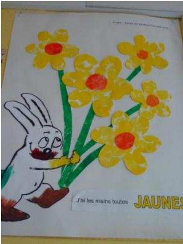
Impressions avec la tranche des mousses des rouleaux à peinture