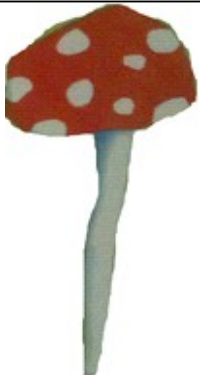
Le champignon de l'automne