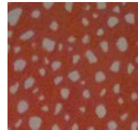
La neige de l'hiver