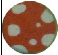
Le ballon de l'été

Au fil du livre, le petit chien voit apparaître des éléments caractéristiques des changements de saison : le ballon de plage de l'été, les champignons de l'automne, les flocons de neige de l'hiver et les fleurs du printemps. Le tout rappelle le travail sur les pois de la période précédente avec l'artiste Kusama.