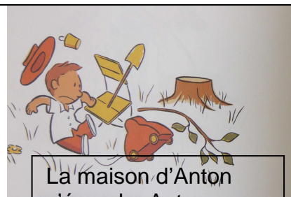
La maison d'Anton s'écroule. Anton pleure.