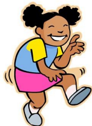
danser en EPS