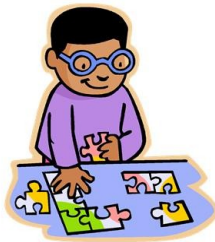
faire des puzzles