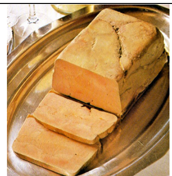
terrine de foie gras