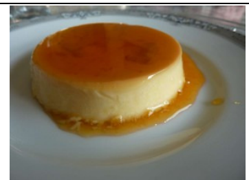
crème dessert vanille