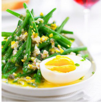
oeuf haricots verts