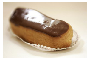
éclair au chocolat