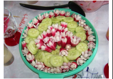
salade de radis concombre