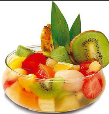
salade de fruits