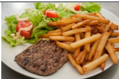
Steak haché -frites-salade