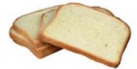
PAIN DE MIE