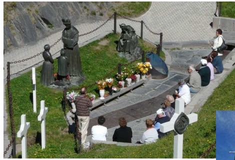
La Salette : Vallon de l'apparition