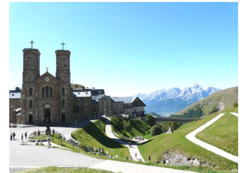
Le sanctuaire de La Salette

Être pèlerin c'est se mettre en marche à la suite du Christ, se laisser guider par Dieu. Au cours de ce pèlerinage nous nous poserons la question : « Comment Dieu nous guide-t-il ? » Nous serons également invités à nous demander comment vivre davantage en disciples du Christ. Deux causeries sont proposées sur ce thème (voir programme).