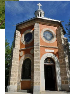
Le Laus : À droite, la chapelle du Précieux-Sang Ci-dessous, la chapelle de Bon Rencontre dans la basilique