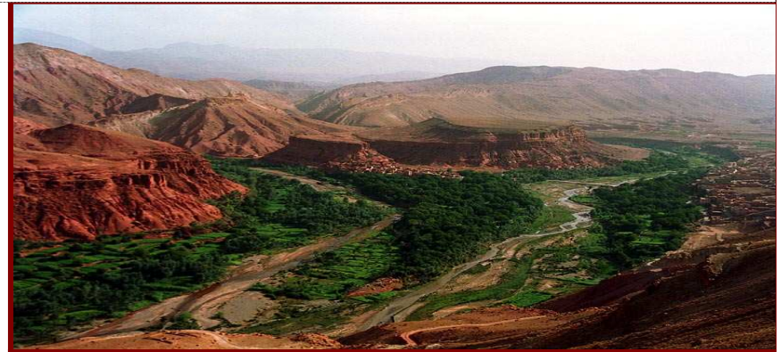
Les gorges du Dadès - Maroc