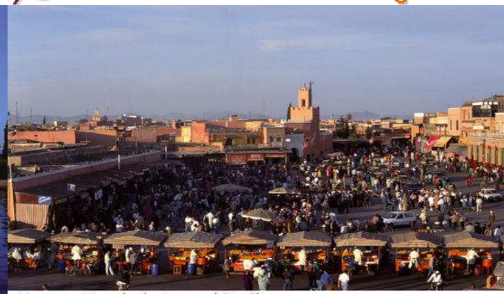
Morocco - Marrakech - Jemaa el Fna Place