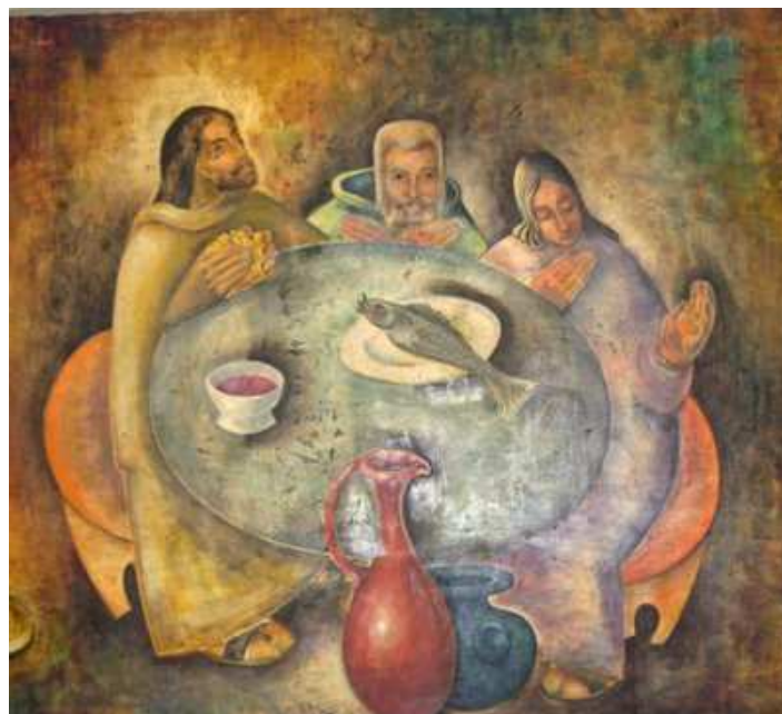
Peinture de Bernard de Brienne, ofm Couvent franciscain du Boul Rosemont, Montréal

L'Ordre Franciscain Séculier a besoin de votre participation !