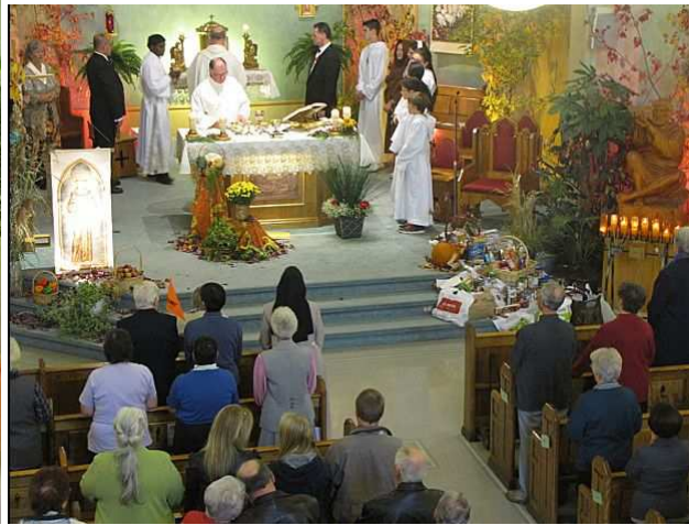
Célébration de l'Eucharistie