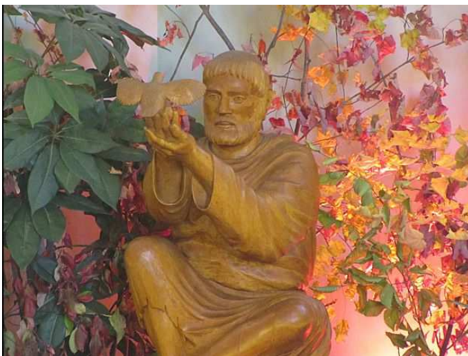
Saint François, une œuvre en bois, d'un paroissien