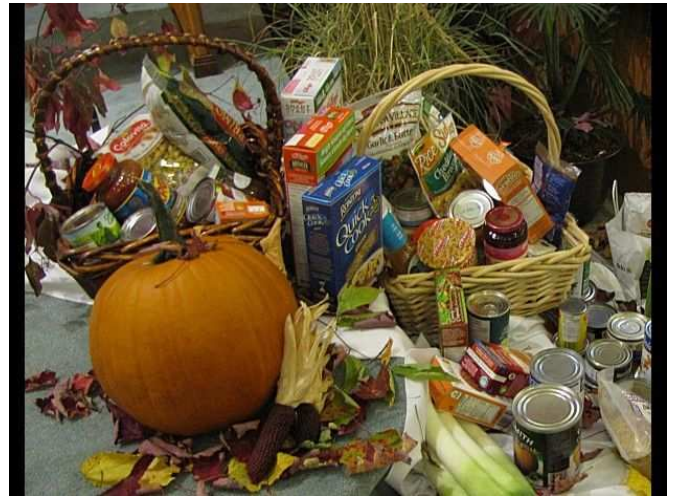
C'était aussi jour d'action de grâce et de partage