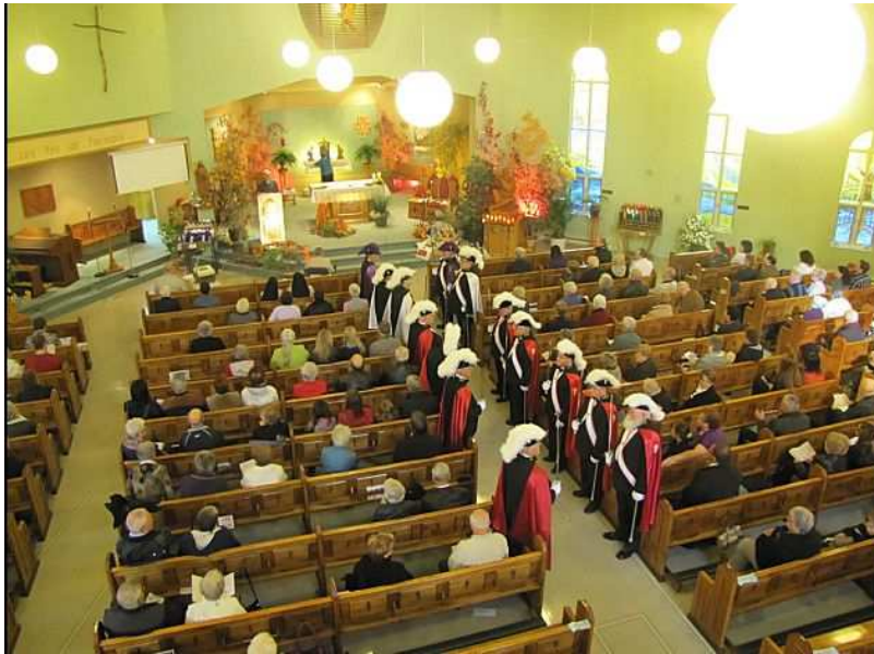
Une partie de l'assemblée et la haie d'honneur des CC

Nous avons remis aux entrées de l'église un feuillet pour présenter les membres de la Famille franciscaine résidant dans le diocèse; soient les sœurs Clarisses, les Missionnaires de Notre-Dame des Anges et les Franciscains séculiers (laïcs) Quelques membres de ces trois groupes ont prié avec les paroissiens-nés afin de rendre grâce au Seigneur pour ses générosités sans borne à leur égard. Les Chevaliers de Colomb s'étaient également donné rendez-vous. Voici donc quelques photos illustrant cette rencontre.