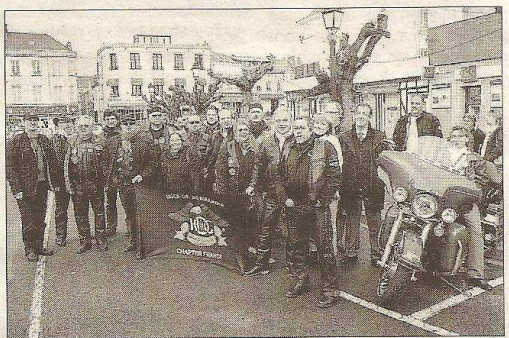
À Pacý, l'association de motards des Ducs de Normandie a donné de son temps pour la bonne cause.