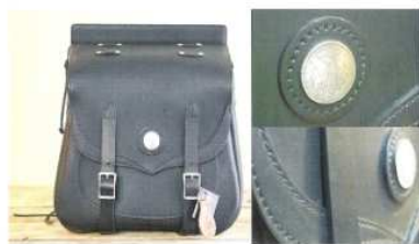
Indian L.46 x H.45 x P.20 cm, capacité 35 litres

Western Bull produit des sacoques entièrement cousues main, en cuir et peau de première qualité. Elles sont conçues pour durer dans le temps. Les sacoques sont adaptables pour une large gamme de motos custom.