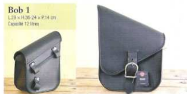
Bob 1 L.28 x H.26-24 x P.14 cm Capacité 12 litres