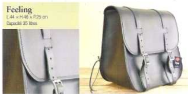
Feeling L.44 x H.46 x P.25 cm Capacité 35 litres