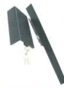
Attache rapide système brevété

D'autres envies, d'autres produits! N'hésitez pas à découvrir notre gamme complète de produits en cuir également réalisés par Western Bull (selles, portefeuilles, portes-clés, portes Mlépass...), d'accessoires pour les sacoques (kit d'assemblage rapide, renfort de sacoques pour éviter l'usure au contact de la roue).