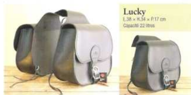
Lucky L.38 x H.34 x P.17 cm Capacité 22 litres