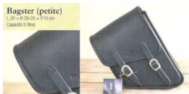
Bagster (petite) L.20 x H.30-20 x P.10 cm Capacité 5 litres