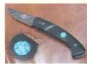
Indian Turquoise Incrustation de turquoise