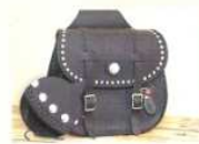
Rider personnalisé Percussions métalliques