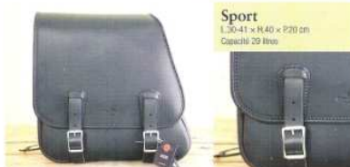
Sport L.30-41 x H.40 x P.20 cm Capacité 29 litres