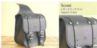
Scout L.20 x H.31 x P.16 cm Capacité 13 litres