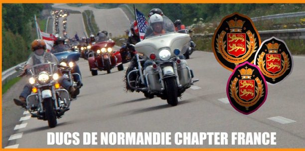
DUCS DE NORMANDIE CHAPTER FRANCE