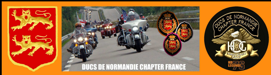
Association « Duc de Normandie Chapter » Loi 1901 - Sous le N°W763006115 Fondée le 24 Août 2009

Les deux léopards sont évidemment notre emblème et nous avons respecté « of course » les couleurs de la Normandie !