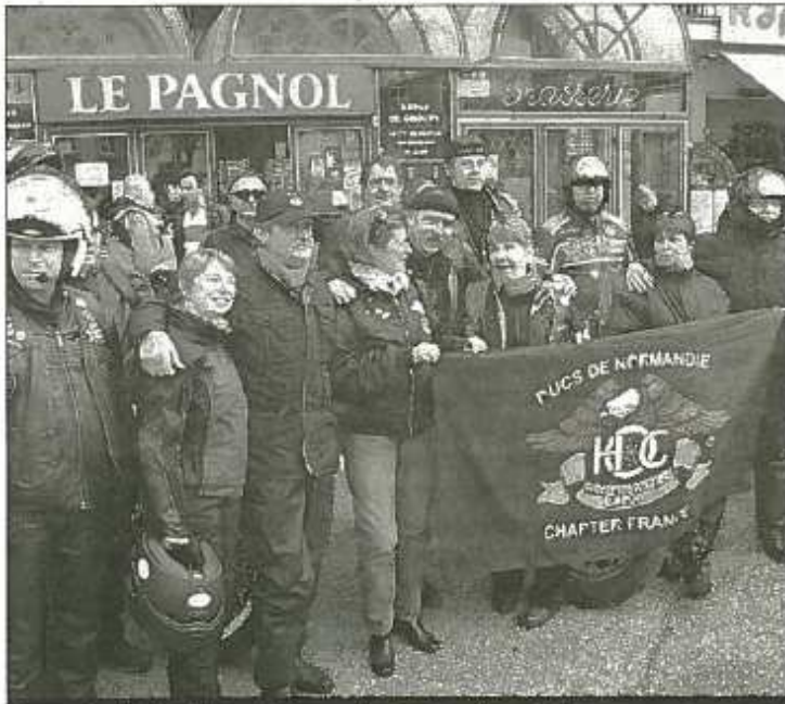
Les motards à pied mais les motos ne sont pas loin