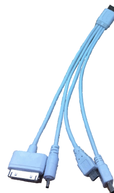
Câble 4 en 1 en option.