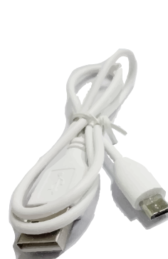
Câble USB fourni