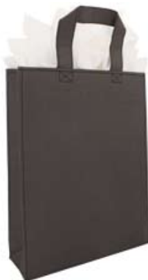
COLORIS GRIS FONCE