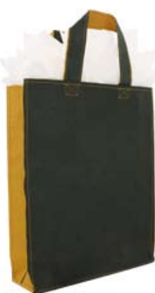
COLORIS NOIR & NATUREL