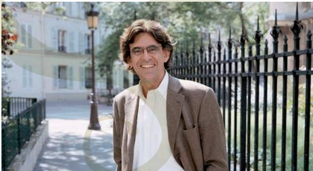
Intervention sur le thème de «l'intégration des jeunes»

En 2002, à cinquante et un ans, il rentre au gouvernement en tant que ministre de la Jeunesse, de l'Education et de la Recherche. Après la refonte ministérielle de mars 2004, lors de laquelle il quitte ses fonctions, il est nommé président délégué du Conseil d'Analyse de la Société (CAS) et entre au conseil économique et social.