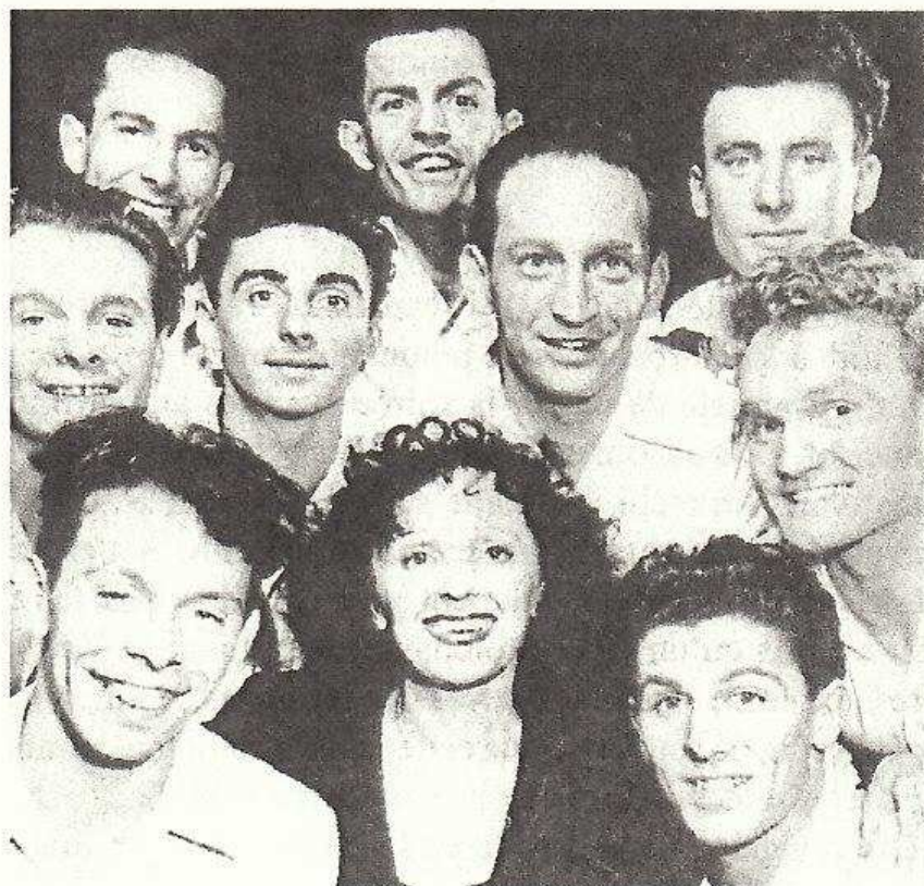
Edith Piaf et les Compagnons de la Chanson