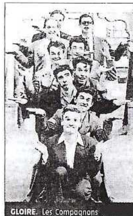
GLOIRE. Les Compagnons