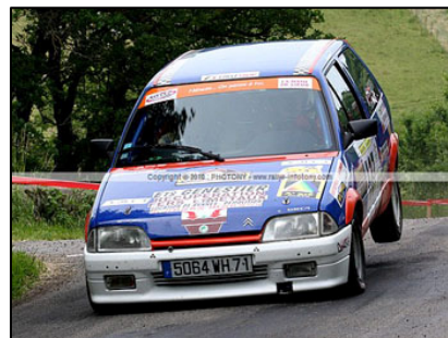
Guillaume Sangouard Vainqueur du Challenge N1 2010

Fort de son succès en 2010, avec pas moins de 117 engagés et près de 5000 € de gains, le Challenge N1 reconduit son opération pour 2011. Cette nouvelle année verra l'arrivée du Challenge N1 copilote mais aussi des épreuves officielles Challenge N1. De quoi donner encore beaucoup d'enthousiasme aux amateurs !!