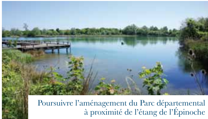
Poursuivre l'aménagement du Parc départemental à proximité de l'étang de l'Épinoche