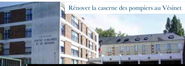
Rénover la caserne des pompiers au Vésinet