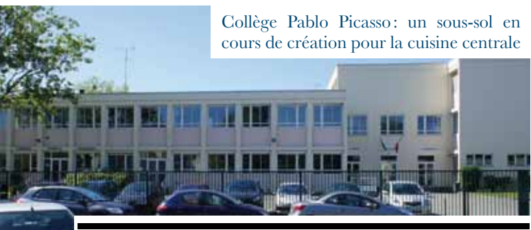
Collège Pablo Picasso : un sous-sol en cours de création pour la cuisine centrale