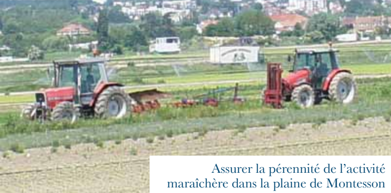
Assurer la pérennité de l'activité maraîchère dans la plaine de Montesson