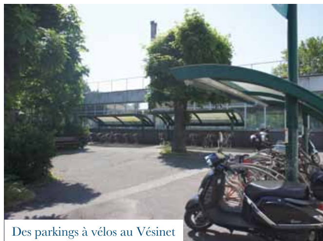
Des parkings à vélos au Vésinet