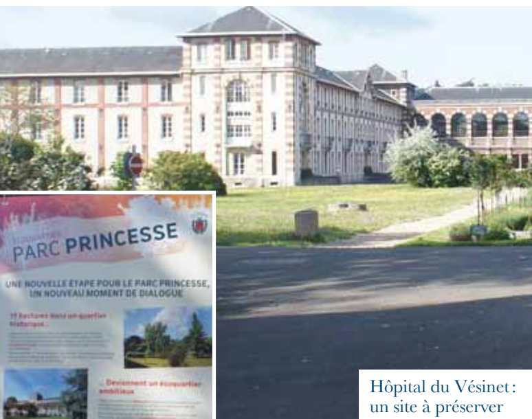
Hôpital du Vésinet : un site à préserver