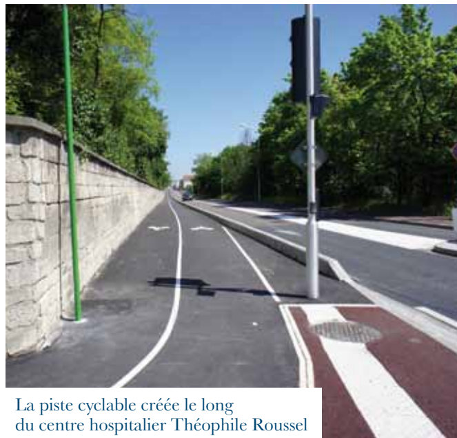
La piste cyclable créée le long du centre hospitalier Théophile Roussel