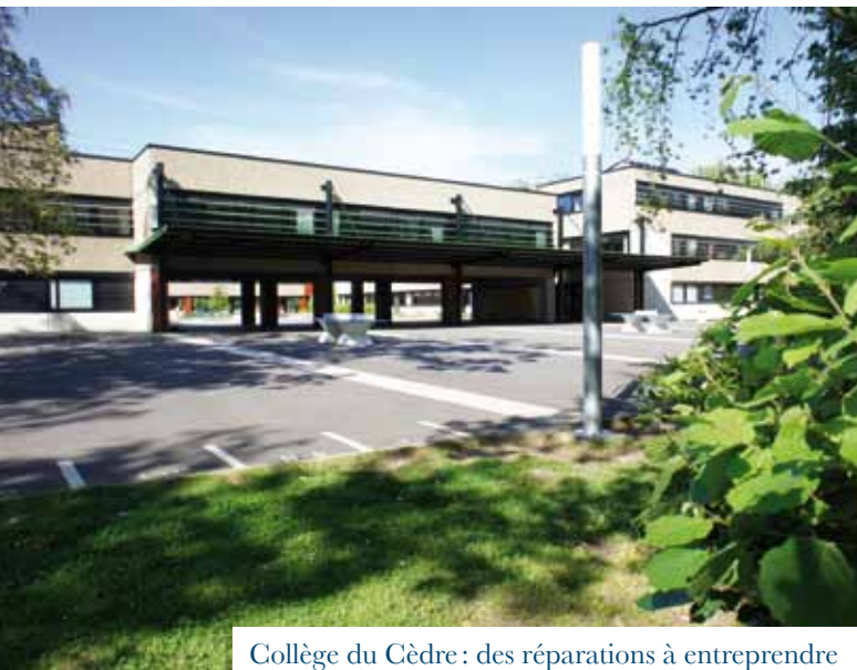
Collège du Cèdre : des réparations à entreprendre