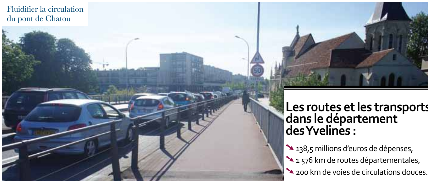
Fluidifier la circulation du pont de Chatou