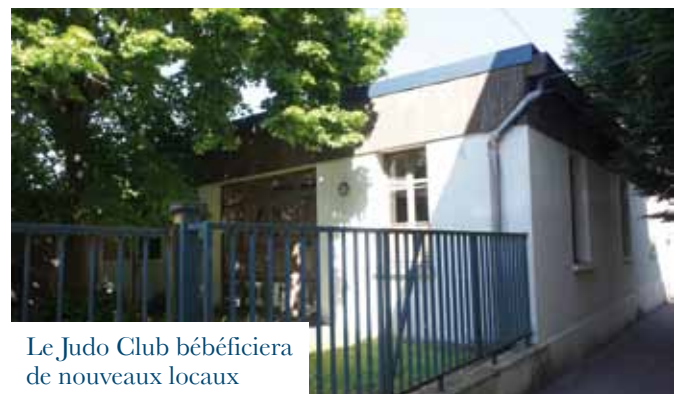
Le Judo Club bénéficiera de nouveaux locaux