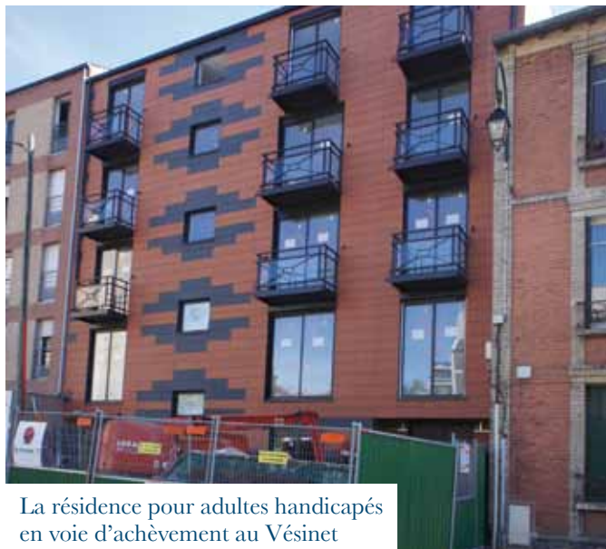
La résidence pour adultes handicapés en voie d'achèvement au Vésinet