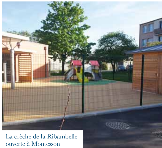
La crèche de la Ribambelle ouverte à Montesson