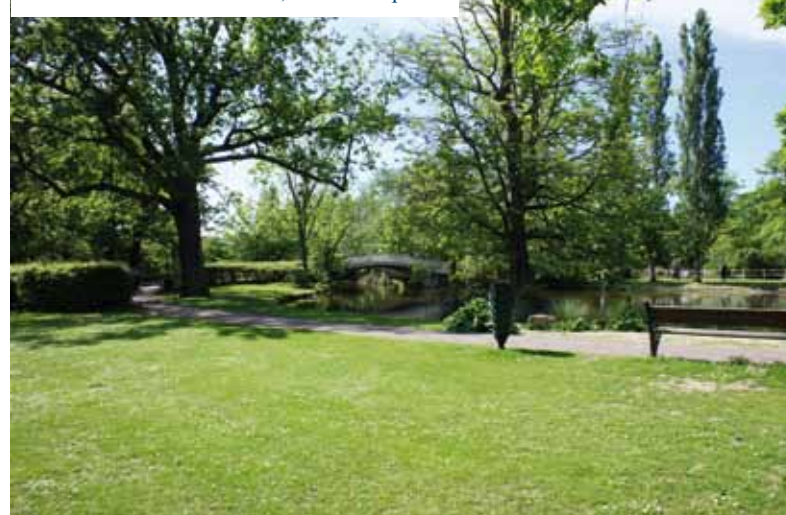
Lac des Ibis. Le Vésinet, une ville-parc