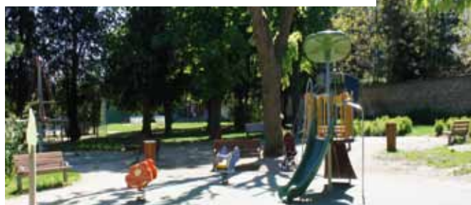
Finaliser l'aménagement du parc des Sophoras