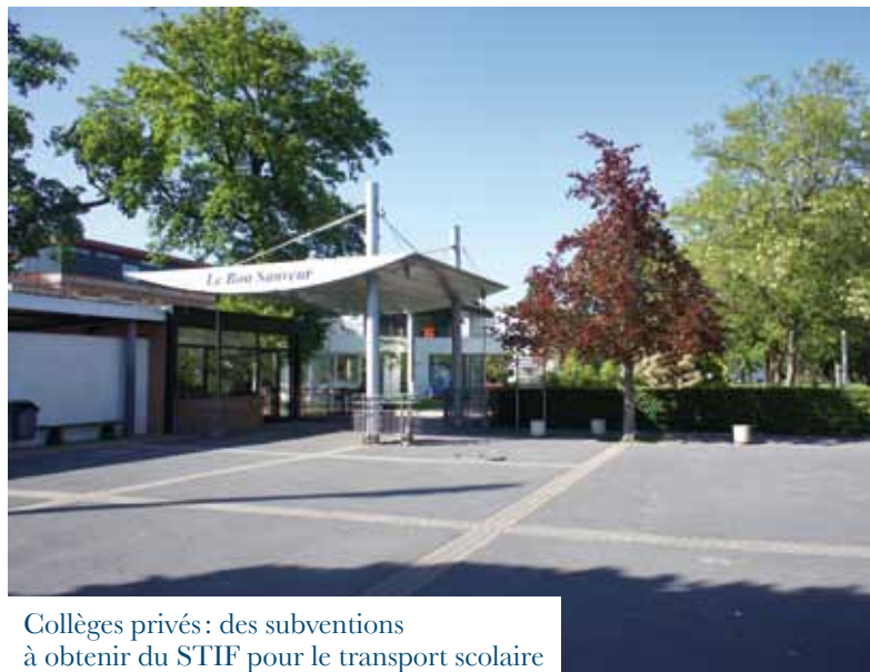
Collèges privés : des subventions à obtenir du STIF pour le transport scolaire