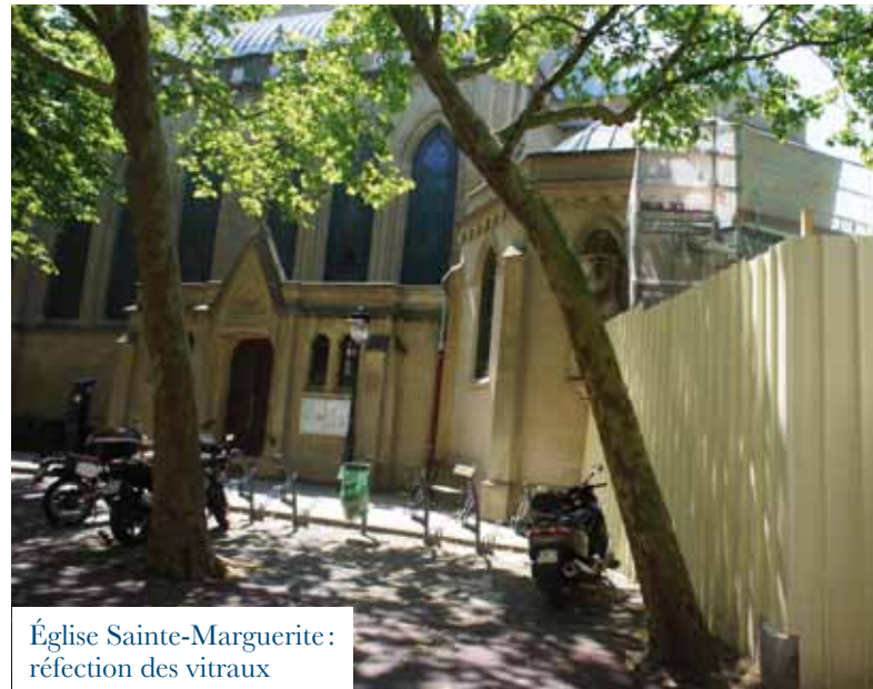
Église Sainte-Marguerite : réfection des vitraux