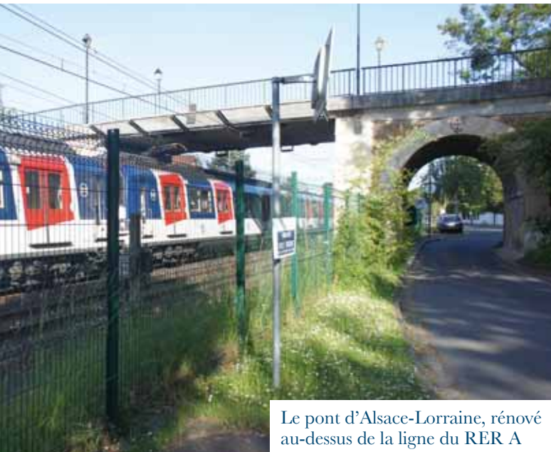
Le pont d'Alsace-Lorraine, rénové au-dessus de la ligne du RER A