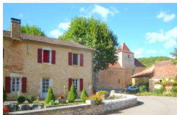
Gigouzac Point de ravitaillement

Pour cette première randonnée officielle du CoDep, nous vous invitons dans le Pays de Catus et c'est à une escapade entre la vallée du Lot et les confins de la Bouriane que nous vous invitons.