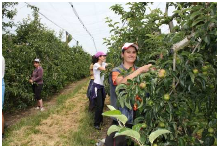
Les travailleurs bulgares ont fait plus de 3.500 kilomètres en voiture pour éclaircir les pommiers de Tastet. Et ils sont prêts à revenir pour la récolte des pommes..

Témoin d'un événement? Alertez nous! Envoyez vos infos à CL