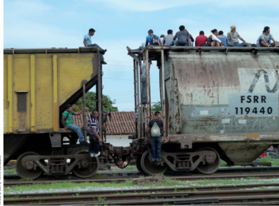
A. Ba © CCFD-Terre Solidaire

Par là même, penser apporter un cadre et des règles pour ces mouvements de population en fermant ses frontières nationales est aussi illusoire qu'irresponsable. La question des migrations doit sortir des arcanes habituels de la seule gestion souveraine des États nationaux pour faire l'objet d'une gouvernance globale multilatérale, fondée d'abord sur les droits fondamentaux des personnes. Cette approche collégiale doit s'appuyer sur des organes et des instruments juridiques internationaux qui permettraient les discussions multilatérales. C'est pourquoi la ratification des outils juridiques internationaux comme la Convention des Nations Unies pour la protection des travailleurs migrants et leurs familles constitue un élément essentiel pour donner corps à cette approche à la fois juste, responsable et humaine. Juste, parce qu'elle implique aussi bien les pays de départ, de transit et d'arrivée; responsable car elle rappelle aussi les États à leurs devoirs; enfin profondément humaine puisque, loin de considérer le migrant comme une variable d'ajustement économique, elle en respecte inconditionnellement la dignité et l'intégrité, notamment sur le plan du droit de vivre en famille. ■