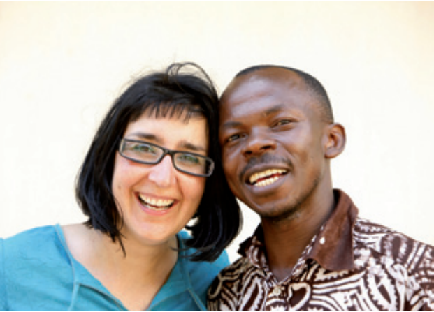
Pascal Deloche © Goding