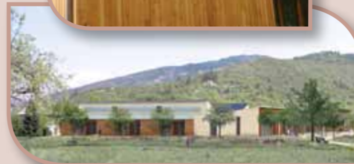
Photomontage du projet d'hôpital de Castellane en cours de construction et qui sera desservi par le plus important réseau de chaleur bois-énergie du Pays. D'une puissance de 500 kW, celui-ci chauffera notamment les bâtiments communaux suivants : les deux écoles, la future crèche, l'ancienne gendarmerie, la salle des fêtes, la maison de santé soit une surface totale de 8 770 m 2