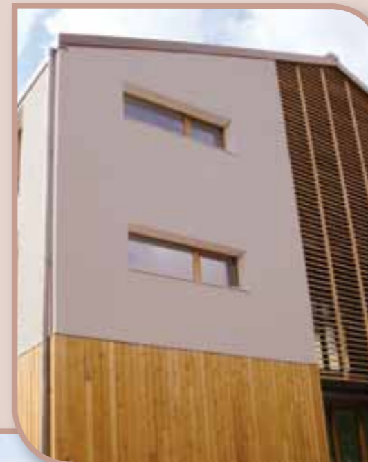
La maison de santé d'Allos sera chauffée au bois dès cet hiver grâce au réseau de chaleur qui desservira de nombreux bâtiments publics : école, poste, mairie, salle des fêtes, médiathèque et logements