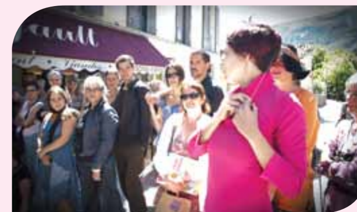
Le Nez - Compagnie Des Corps Parlants- Les Mouvements-T- Annot le 28 mai