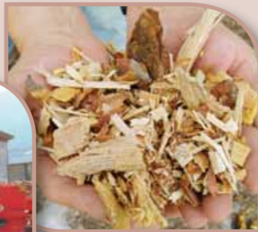
Le bois énergie en plaquettes permet une valorisation des déchets de coupe forestière et de scierie