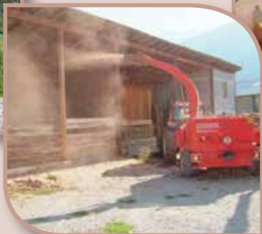
La forêt couvre près de 55 % du territoire du Pays