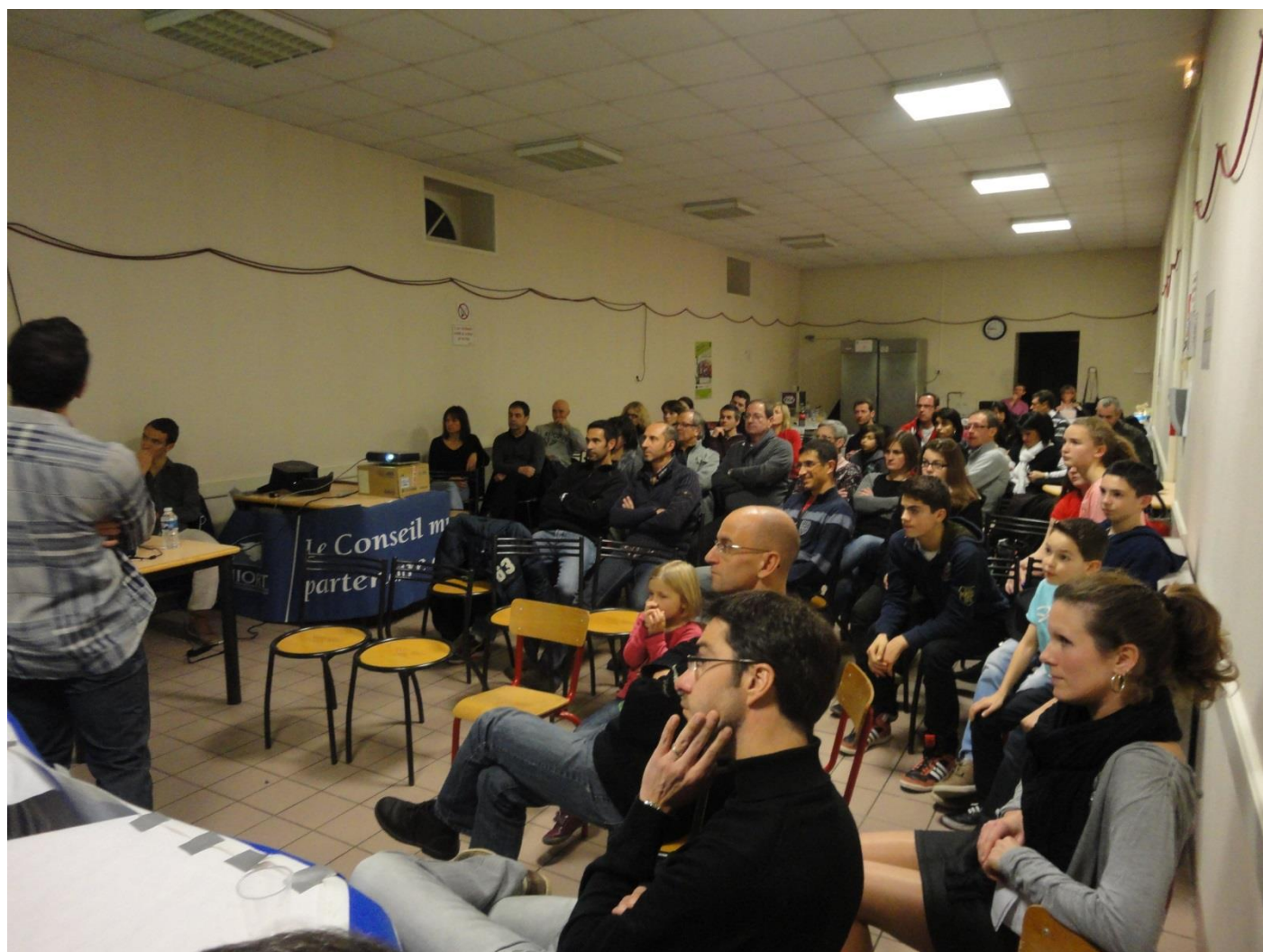
L'assemblée attentive accrochée aux lèvres de notre Président...