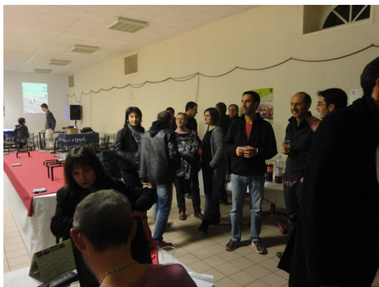
Les adhérents arrivent tranquillement à partir de 20h