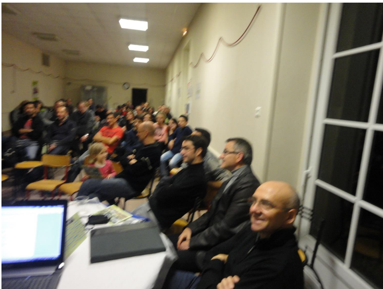
Pèrejag entre Jag et Jmpi après son intervention sur le bilan financier

David rebondi toutefois sur le fait que la vente de la tombola est importante pour la vie de l'association et que chaque adhérent doit y participer.