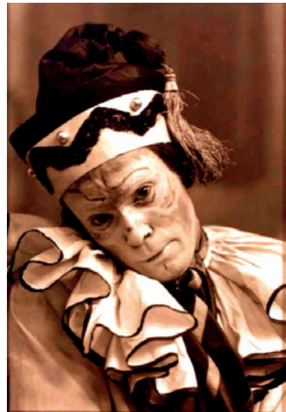
Le danseur Nijinski, créateur de Petrouchka

Une version scénique pour marionnettes - commande du FDL - sera présentée pour ces soirées.