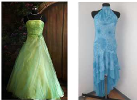
VÊTEMENTS DE GRANDS COUTURIERS VOLÉS LE 21 MAI - CHB. 321