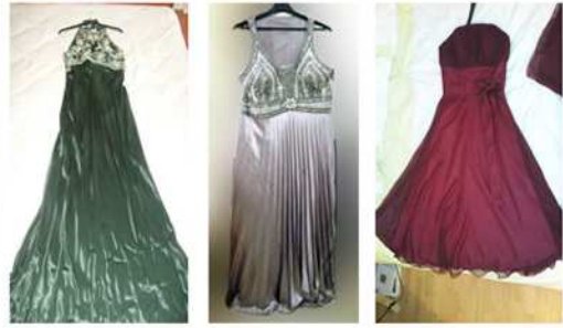
ROBES DE SOIRÉE VOLÉES LE 3 MARS - CHB. 307