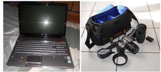
ORDINATEUR + APPAREIL PHOTO VOLÉES LE 25 MARS - CHB. 217