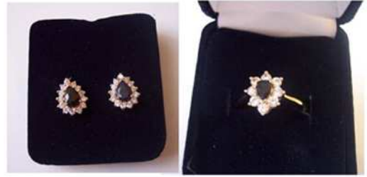
BIJOUX VOLÉS LE 10 MARS - CHB. 313