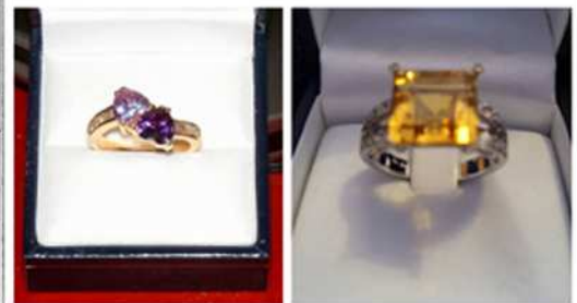
BIJOUX VOLÉS LE 7 MAI - CHB. 301