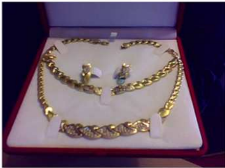
BIJOUX VOLÉS LE 16 MARS - CHB. 339