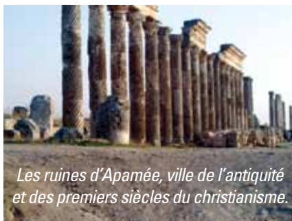
Les ruines d'Apamée, ville de l'antiquité et des premiers siècles du christianisme.