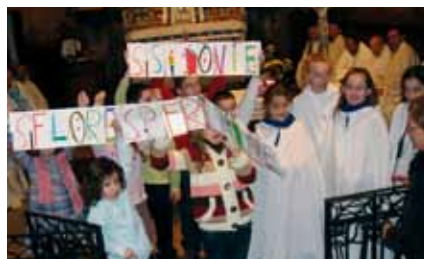
Les enfants souhaitent la bienvenue aux sœurs.