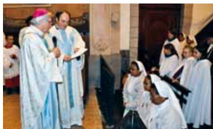
Bénédictio des sœurs par Mgr Jean-Michel di Falco Léandri.