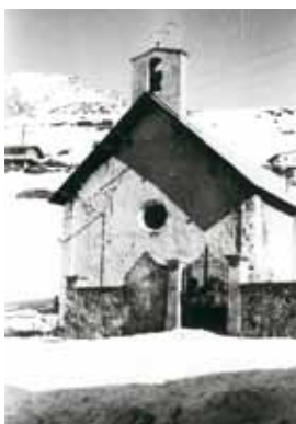
L'église Notre-Dame à Sainte-Marie, remplacée en 1970 par le centre œcuménique.

Il y a encore deux ou trois générations, les soirs de veillées, lorsque les jours étaient courts et que la neige ralentissait le rythme des travaux, les Varsincs se rassemblaient et la transmission orale construisait un socle, des repères, un patrimoine vivant. Poursuivant cette tradition, Odile David et Olivier Vincent sont allés à la rencontre des aînés. Il en sort un livre, mémoire vive pour les nouvelles générations.