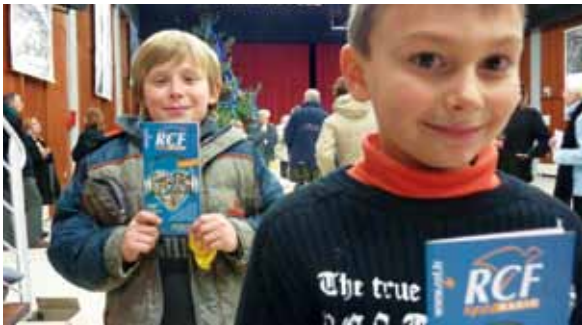
Il n'y a pas d'âge pour écouter RCF. Des enfants avec le programme de la radio à L'Argentière.