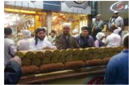
La fête de l'Aïd el Adha dans le quartier de Midan à Damas.

Un autre des enjeux est celui de la dispersion des communautés chrétiennes. En effet, de plus en plus de chrétiens vivent en banlieue, dans des quartiers,