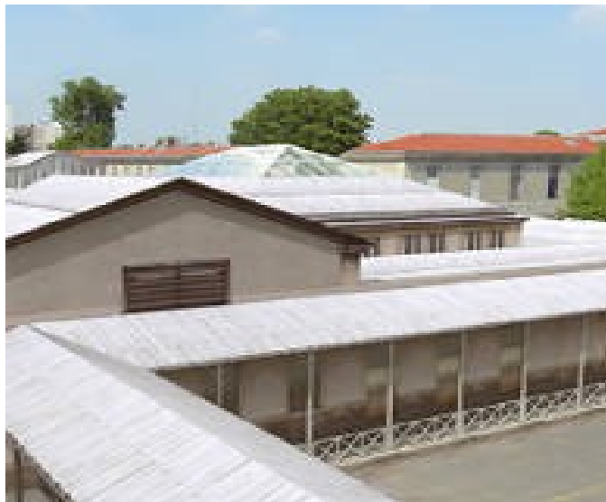
Hôpital gériatrique Charles-Foix.

Il est nécessaire de les maintenir. Il est coupable de les fermer de la sorte. Leur maintien est une nécessité pour tout le monde. En premier lieu pour les personnes âgées elles-mêmes et en pensant à long terme à notre propre avenir, nous sommes toutes et tous concernés par ce fléau qu'est le vieillissement qui est une maladie mortelle comme une autre en dépit de ce qu'affirment par erreur les ignorants ou des médecins qui ont décidé de baisser les bras.